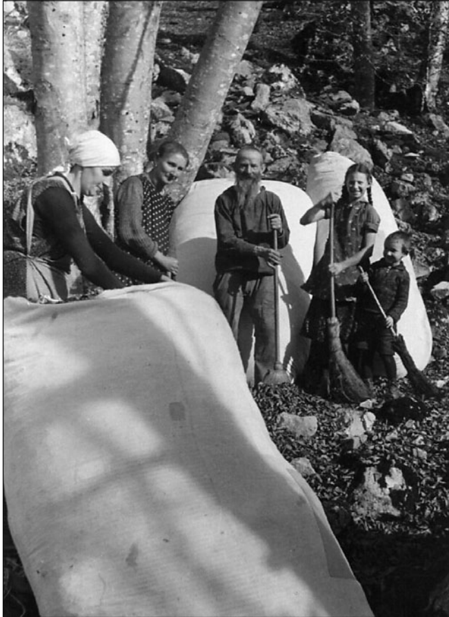
Abbildung 3: «Beim Bettlauben im Gonzenwald ist die ganze Familie beschäftigt.»

Um 1940, F. Moser-Gossweiler, Romanshorn. Privatarchiv M. Bugg, Berschis.