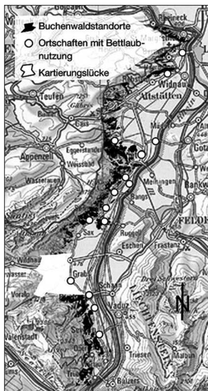
Abbildung 1: Verbreitung des Bettlaubsammelns im Untersuchungsgebiet.

In dieser Arbeit wurde die Methode der Oral History angewendet, bei der die Inhalte mündlicher Überlieferung ausge-