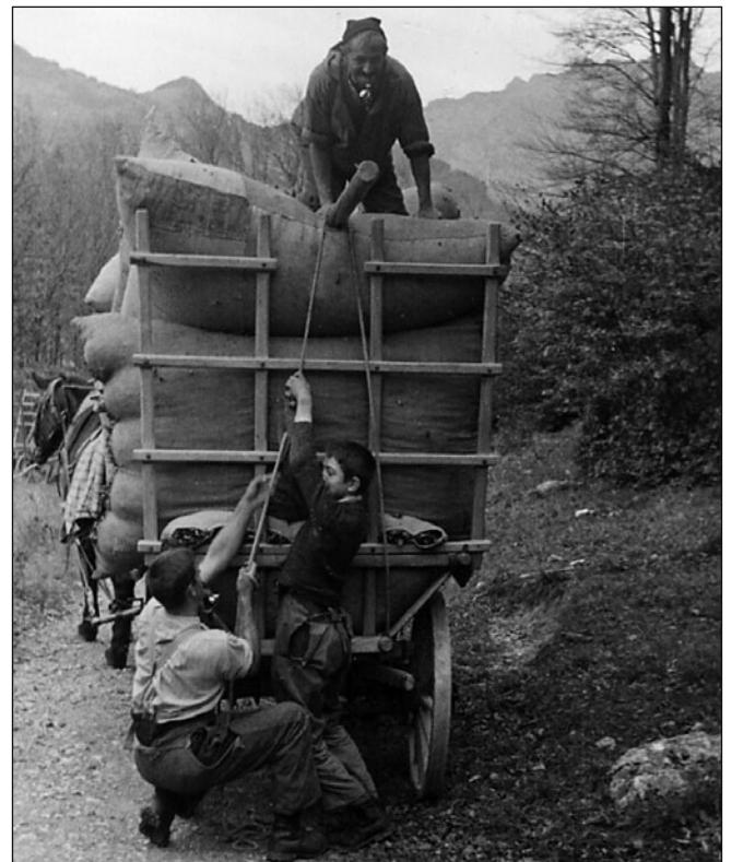
Abbildung 5: « Das Bettlauben im Gonzenwald. Das Laubsackfuder wird festgebunden.» Um 1940, F. Moser-Gossweiler, Romanshorn. Privatarchiv M. Bugg, Berschis.