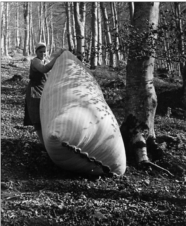
Abbildung 4: « Bettlauben im Gonzenwalde ob Sargans. Die gefüllten Laubsäcke werden den Hang hinunter geworfen, wo sie in munteren Sprüngen den Halteplatz des Wagens erreichen.» Um 1940, F. Moser-Gossweiler, Romanshorn. Privatarchiv M. Bugg, Berschis.

In Werdenberg war das Laubsammeln nur für die Ortsbürger gratis – andere mussten eine Taxe bezahlen (HUGGER, zitiert in GABATHULER 2003). Aus den Reglementen und Wirtschaftsplänen geht hervor, dass dies zum Beispiel in Sevelen, Grabs, Frümsern, Lienz, Buchs und Wartau (hierzu GABATHULER 2003) der Fall war. Auch die Laubkarten belegen die Praxis der Nutzungsgebühr (Abbildung 2). In Sennwald mussten gar alle einen Ausweis besitzen, um lauben zu dürfen (GABATHULER