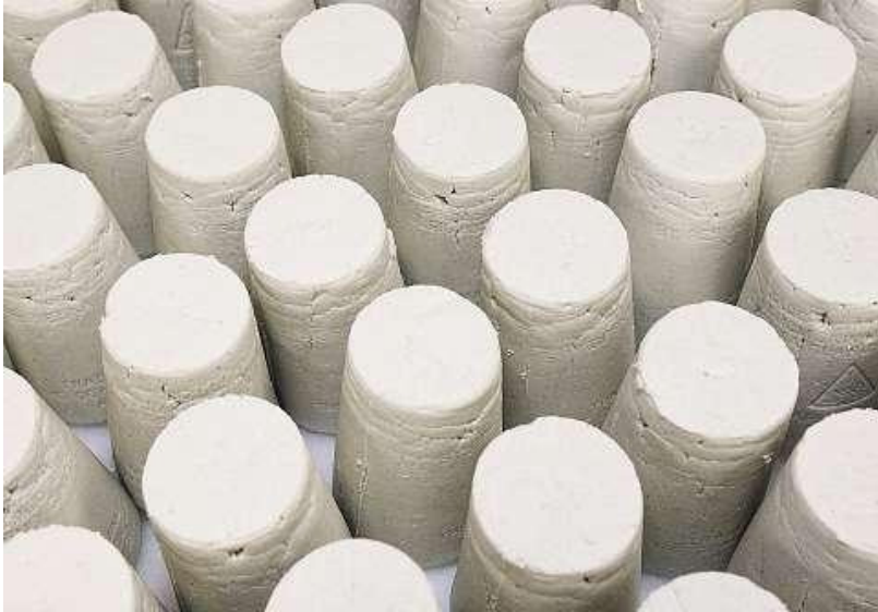
Rohziger: ohne das Kleepulver noch weiss.

Da steht er nun im Kühlschrank und – steht. Es war einfach, ihn aus dem Supermarktregal in den Einkaufswagen zu legen. Schwieriger ist es, etwas mit ihm anzufangen. Denn ehrlich gesagt ist Schabziger eine komplizierte Sache, zumindest, wenn man nicht aus Glarus kommt. Dass er nicht nur aufs Brot gehört, scheint klar zu sein angesichts des wenig dezenten Dufts, der einem sofort beim Öffnen der Verpackung entgegenströmt.