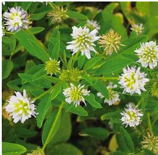
Der hier in voller Blüte stehende Zigerklee kommt exklusiv aus Lachen (Schwyz).