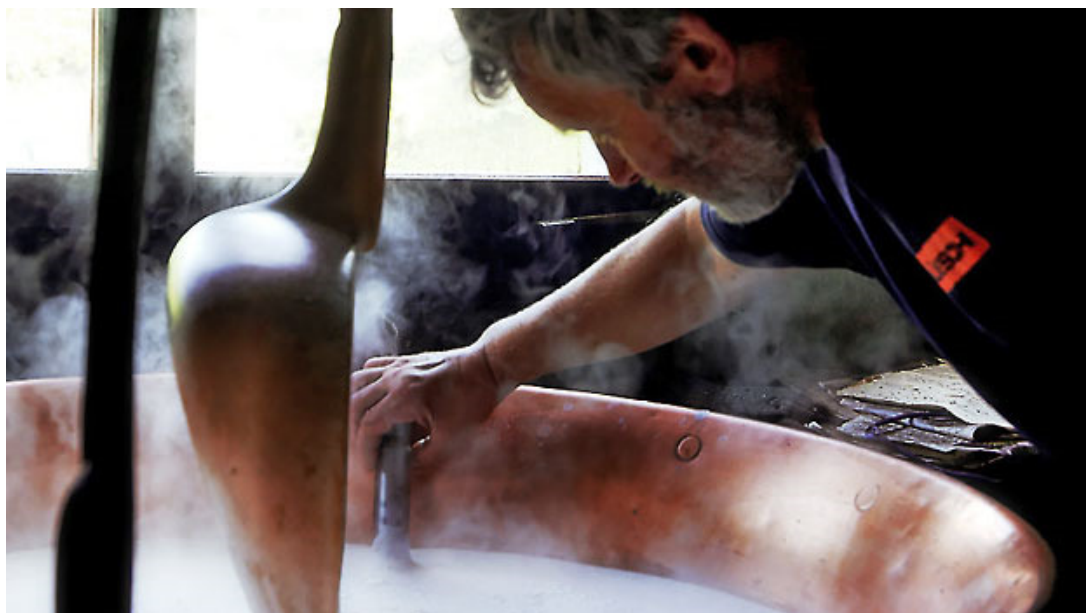
Das Zigern ist eine heisse Angelegenheit. Siehe auch Bildergalerie: Alpzigern auf Alp Bärenboden GL

Eine alte Idee könnte in einer solchen neuen Sennerei wieder aufgenommen werden, nämlich den Alprohziger als Alpziger separat zu verkaufen und nicht dem Talziger beizumischen. Aber soweit ist man noch nicht.